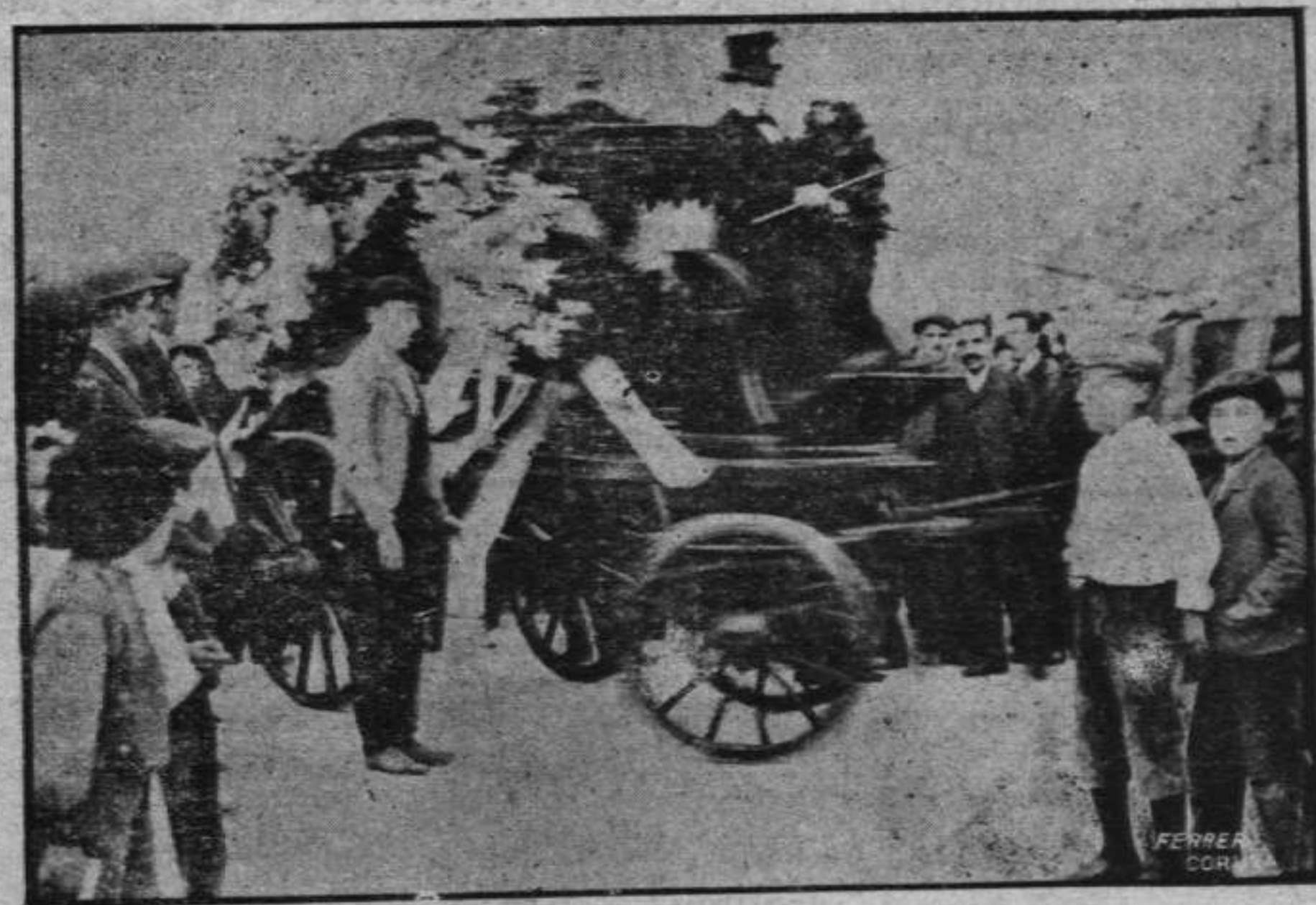
ENTIERRO DEL DESGRACIADO BOTERO ENRIQUE IGLESIAS CANTELAR

Falleció éste en el Hospital civil al siguiente día, de resultas de las graves heridas que le ocasionaron las paletas de uno de los vapores de Ferro, en el momento de desembarcar el pasaje.