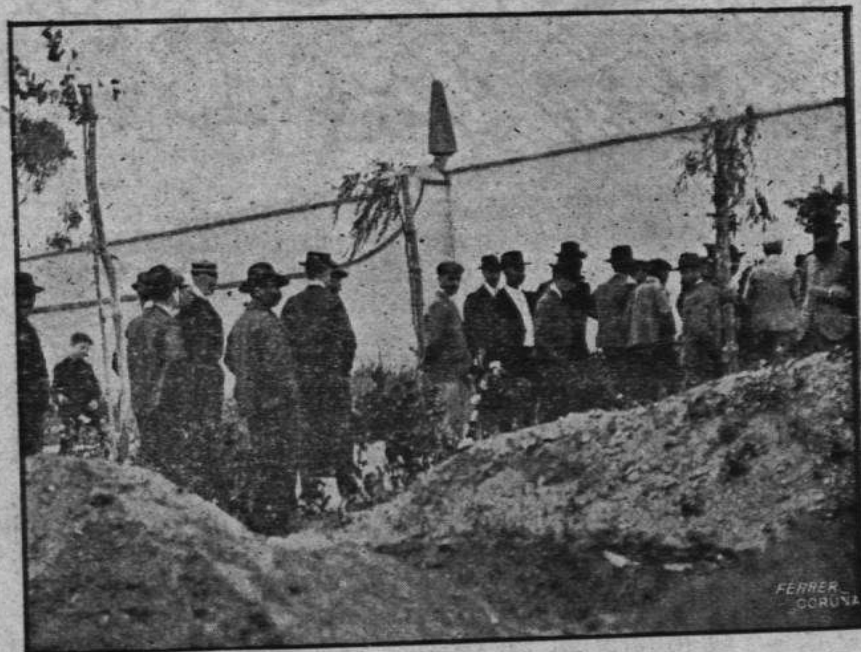
LA COMISIÓN DE SOCIALISTAS DEPOSITANDO LA CORONA EN EL CEMENTERIO CIVIL

Los socialistas Yáñez y Chacón cumplieron el triste y cariñoso encargo.