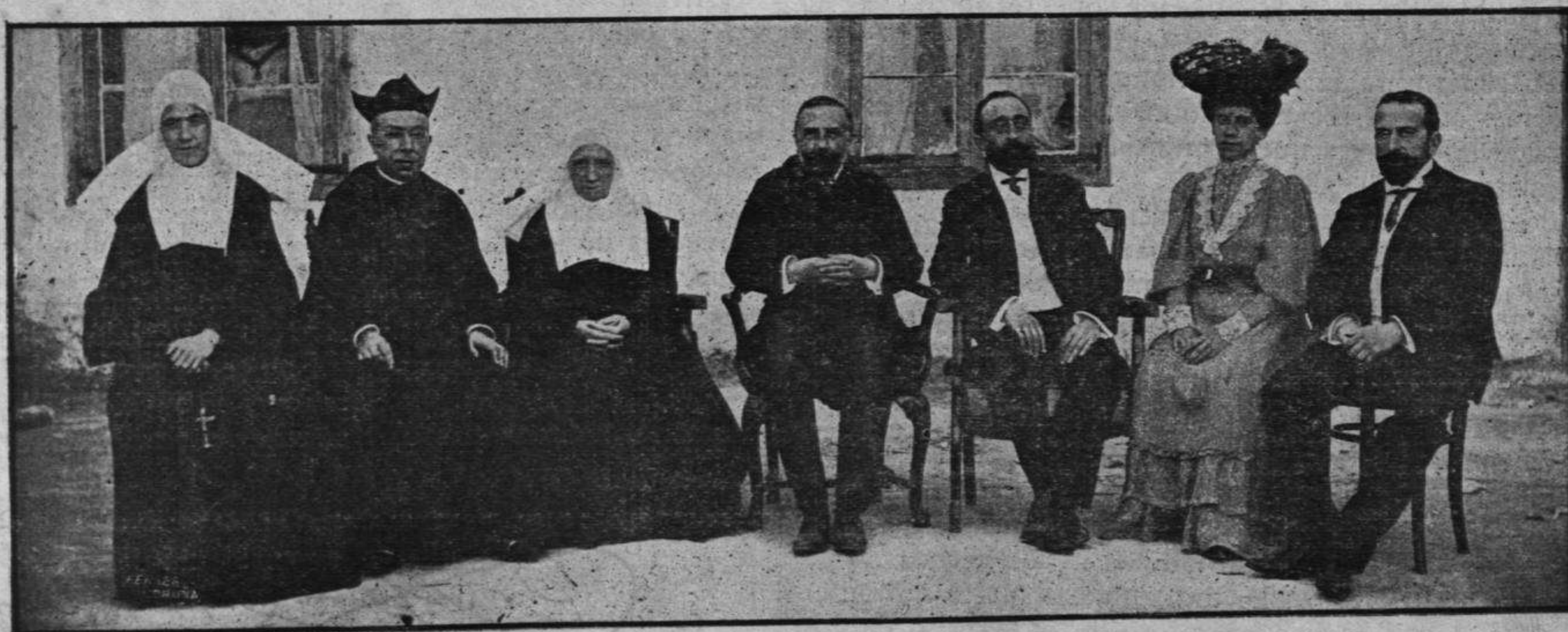
TRIBUNAL EXAMINADOR DE LOS ACOGIDOS DEL HOSPICIO