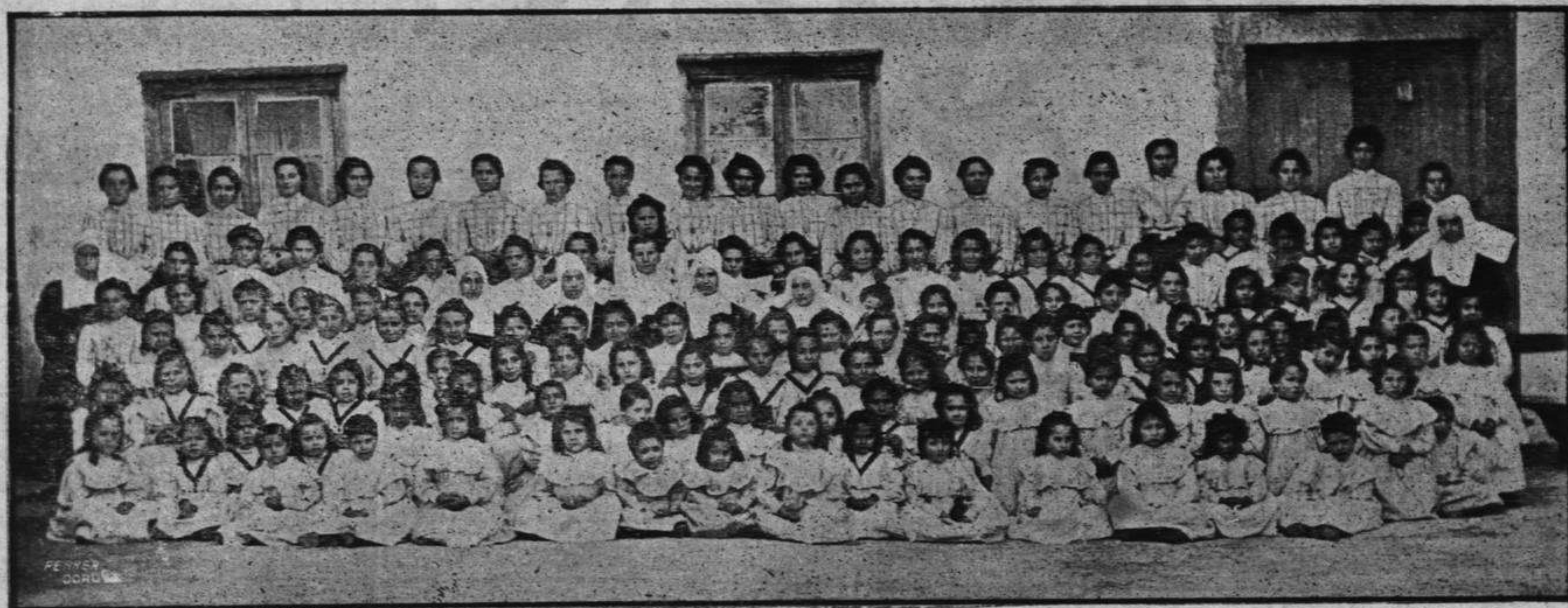
GRUPO DE LAS ACOGIDAS QUE FUERON EXAMINADAS