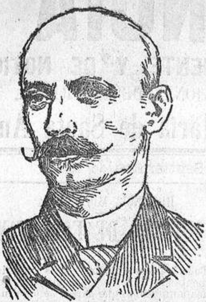
DON FIDEL RECIO Presidente de la Diputación Provincial de Valladolid.