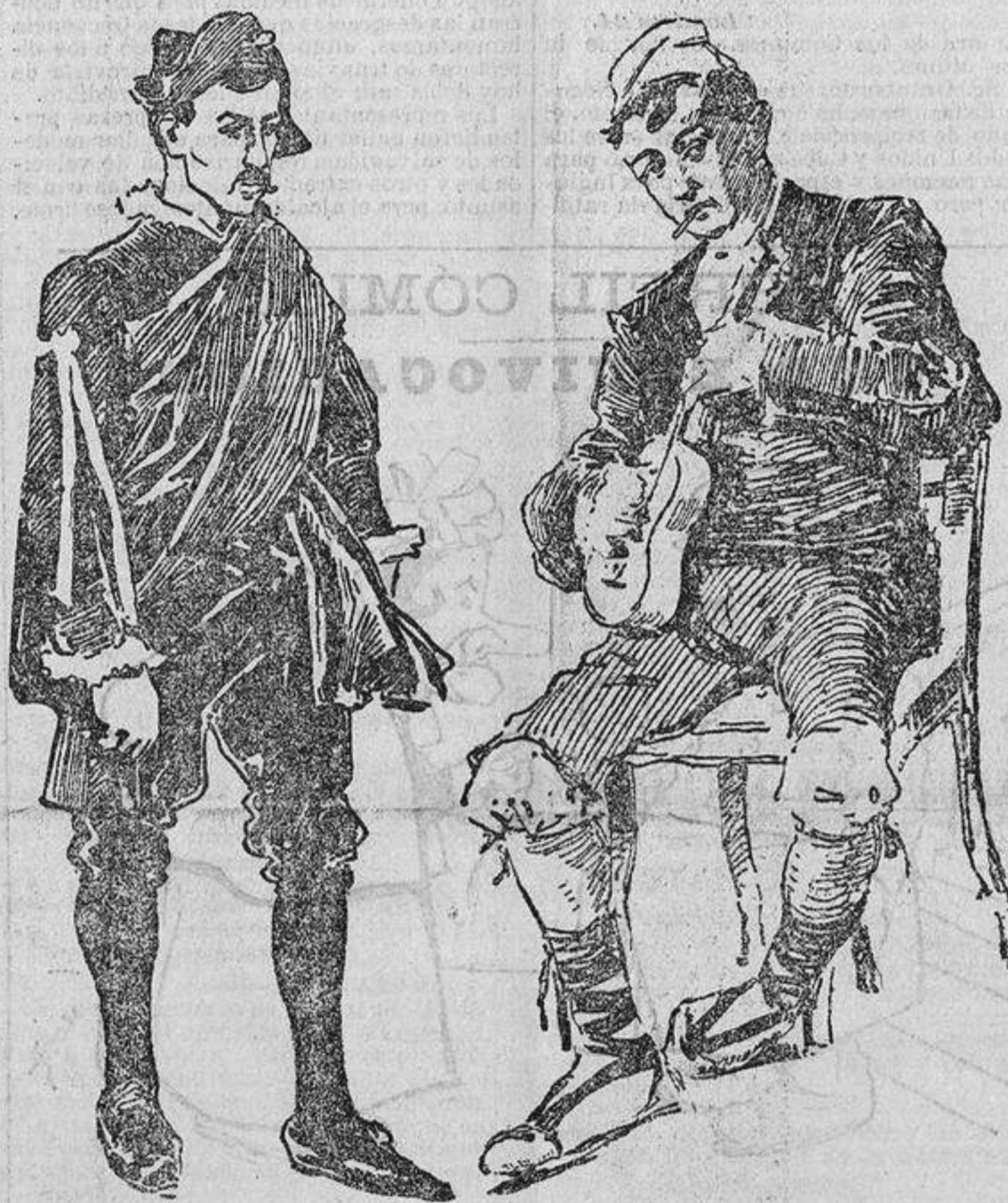
De la FIGARO LINARENSE De la RONDALLA DE HUESCA

BIBLIOTECA DE LA CORRESPONDENCIA DE ESPAÑA