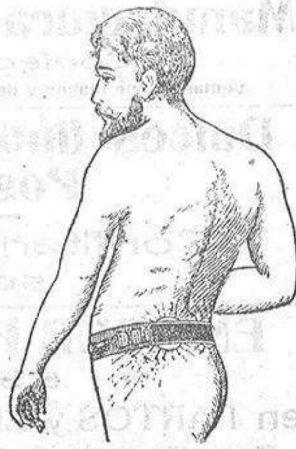
Marca registrada Núm. 28 457.