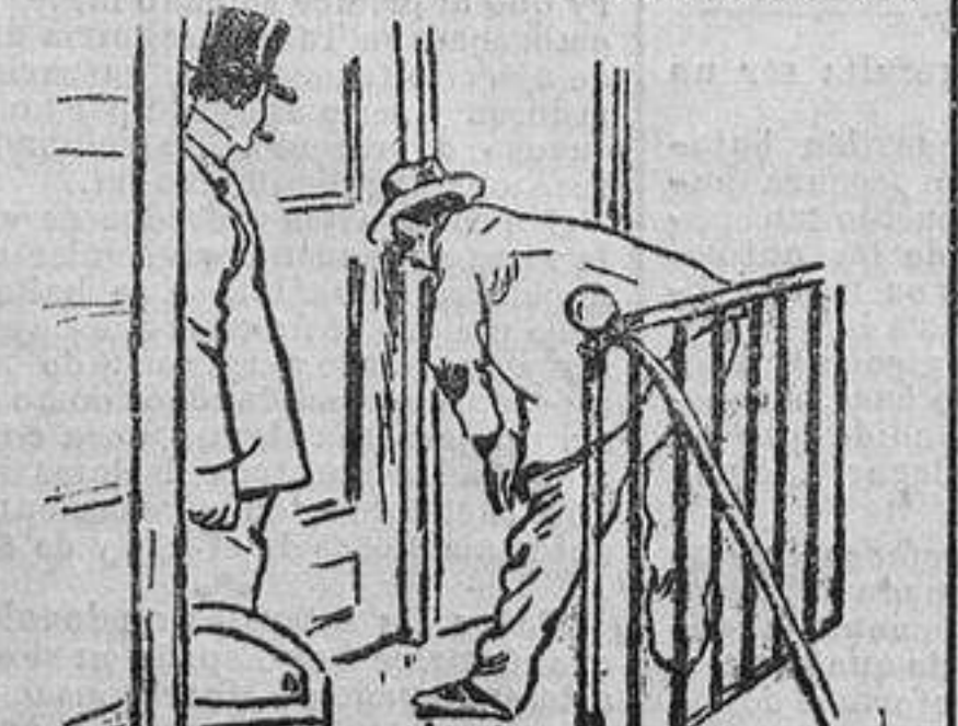
Ilustración de un oficial.

que Anastay había quedado de reemplazo por enfermo.