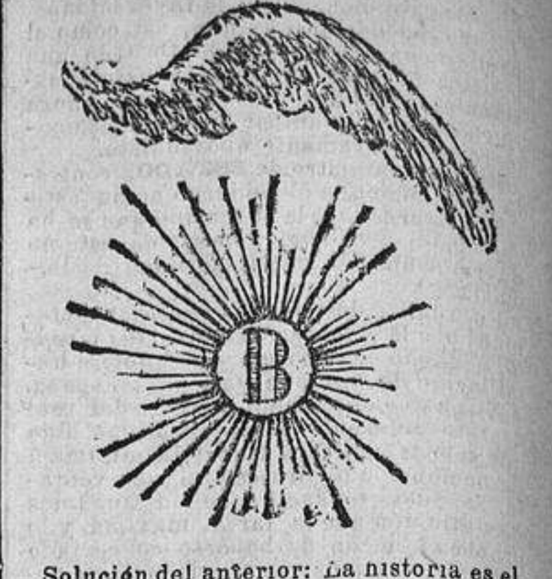
Solución del anterior: La historia es el libro de los pueblos.