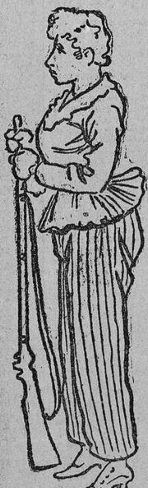
UN APUNTE DEL ENSAYO