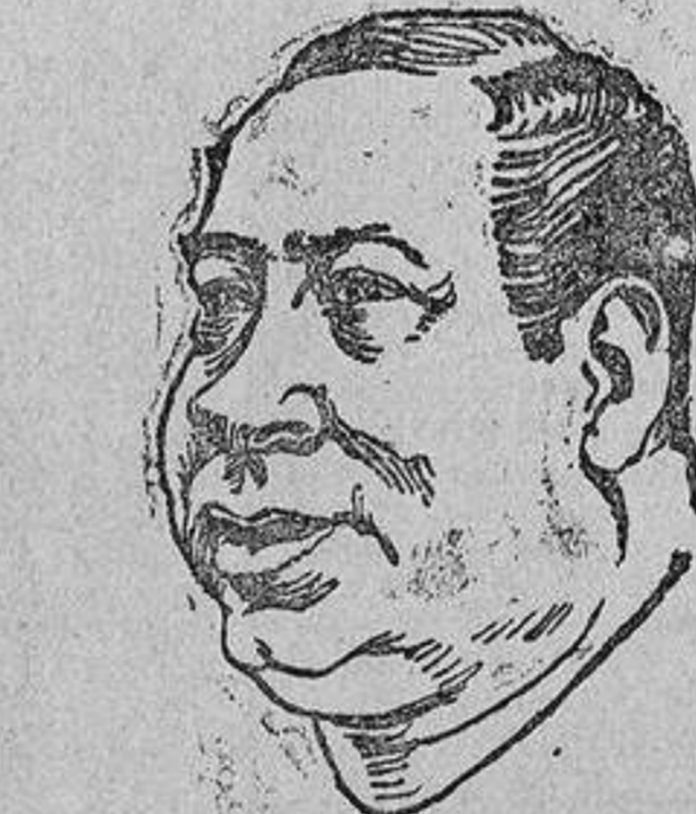
SR. HIDALGO Los tíos del cadete auténtico y el falsificado