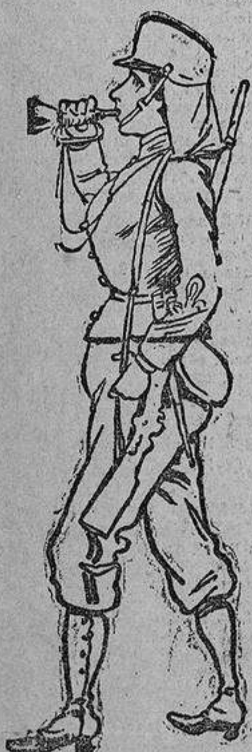
EL CABO DE CORNETAS Pues señor, esto se alaba! No es menester alaballo. ¡Qué tallo!, digo ¡qué tallo! ¡Qué cabot!... digo ¡¡¡qué Cabat!!!