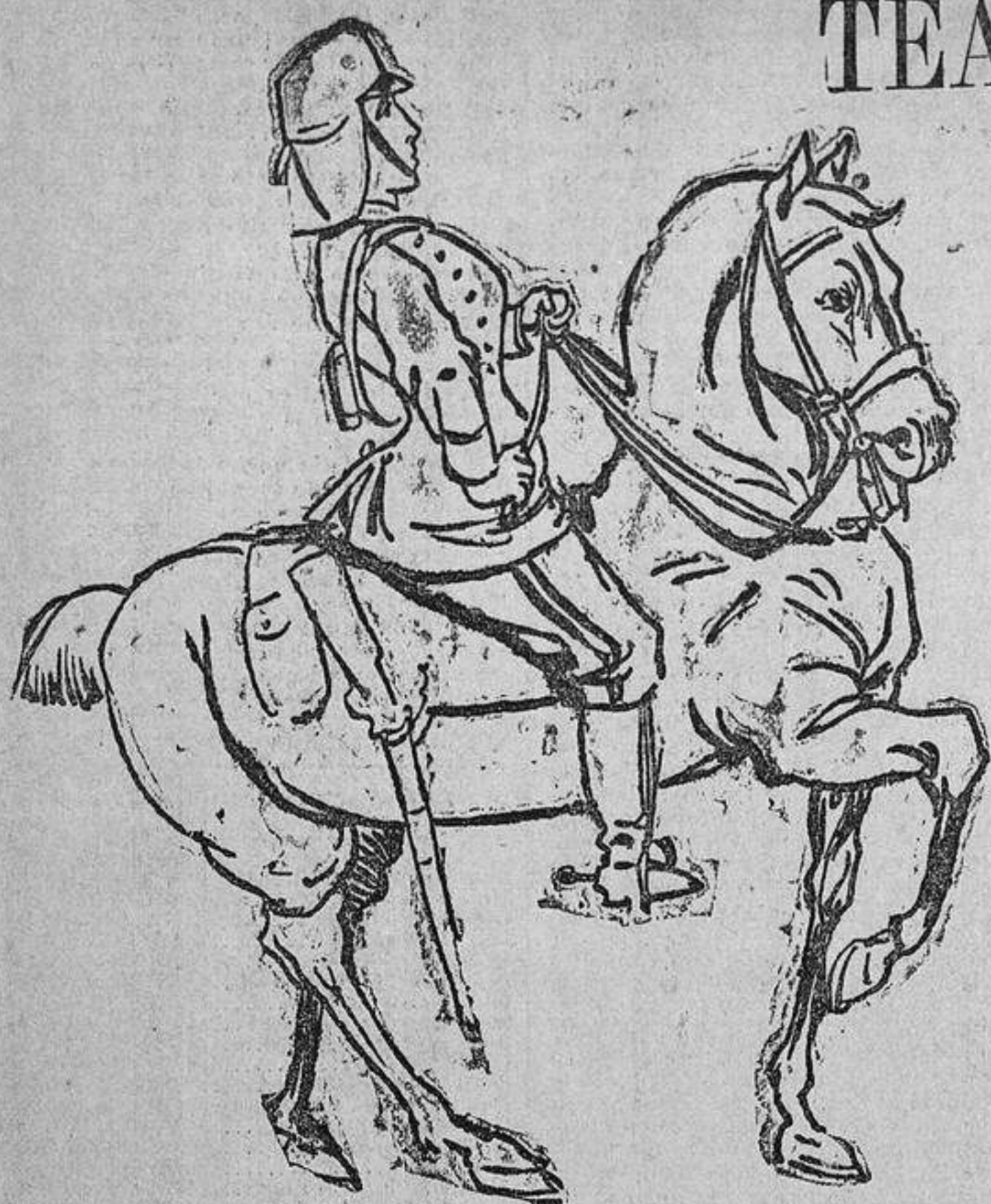
UNA PLAZA MONTADA Como á algun paisano atrade esta de caballeria, asegurarse podria que no irá al paso, irá á escape.