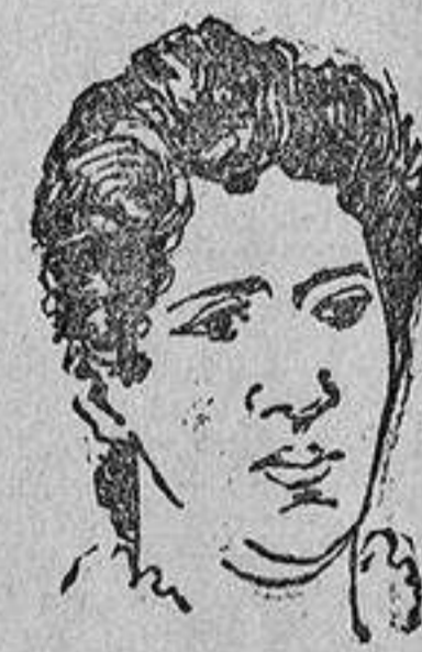
SRA. ALVERÁ.—Novio de la cadete Paa.