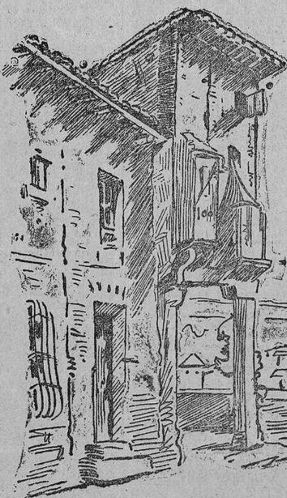
CUADRO SEGUNDO.—(Decoración del Sr. Busato.)