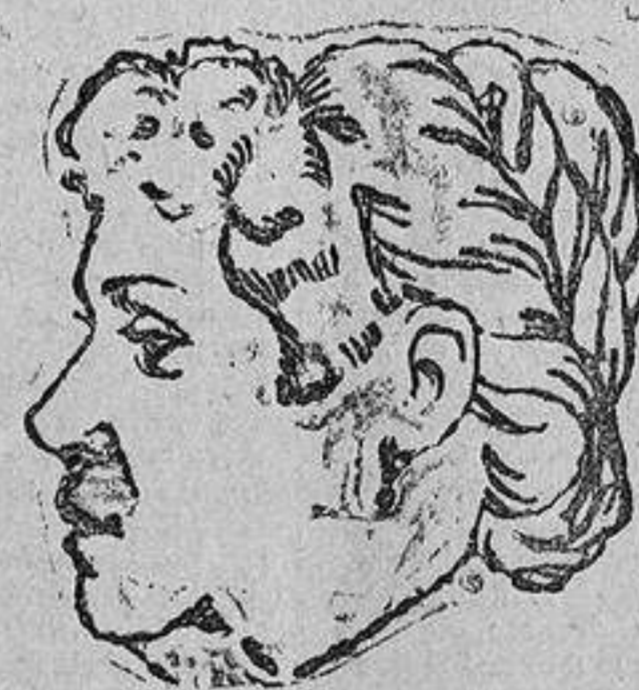
SR.TA. MEJIA Este no aparece porrazones especiales