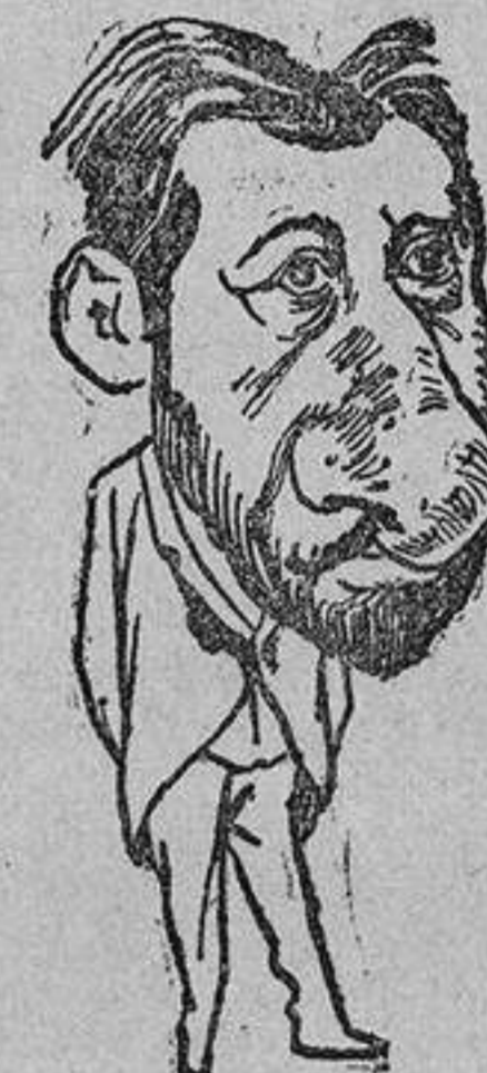
EL AUTOR! EL AUTOR! No es Jackson un aprendiz, es un reputado autor que olfateó, con gran nariz, lo de La espada de honor.