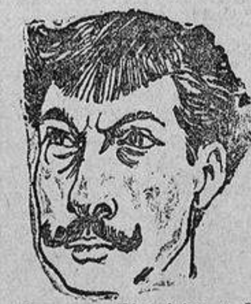
PINEDO.—El asistente del apítan instructor.