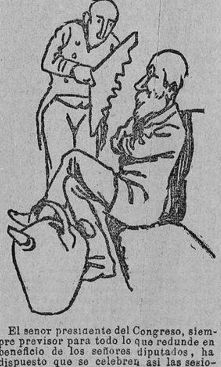
El señor presidente del Congreso, siempre previsor para todo lo que redunde en beneficio de los señores diputados...

SOLUCIÓN A LA ANTERIOR: SATÍRICA. NOTA SATÍRICA DEL DIA.