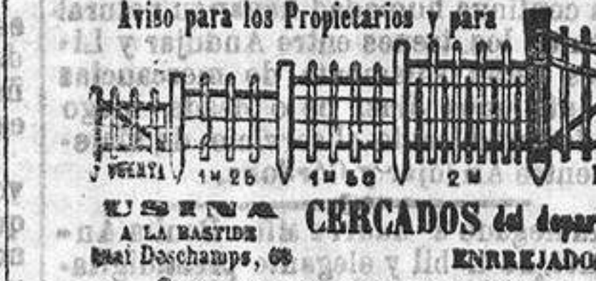
CERCADOS del departamento DE LA GIRONDA ENREJADOS A LA MECANICA.

CONDICIONES PARA LAS MÁQUINAS SE PUEDEN TRANSMITIR Á INGLATERRA POR CAMÍO DE CUALQUIERA CASA DE COMERCIO TENIENDO CORRESPONSALE EN INGLATERRA.