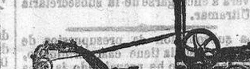
BOMBAS DE VAPOR, PARA OBRAS DE REGAR.