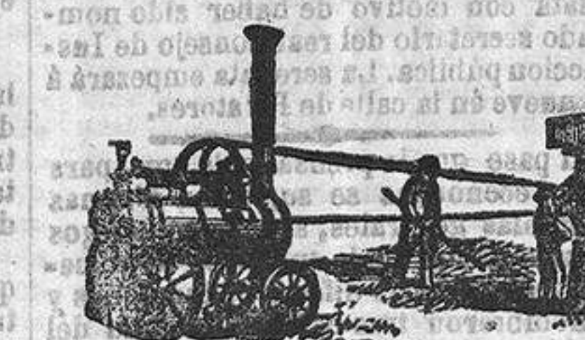
Trilladoras de Vapor, con Aparatos (de patente) para despedazar y machacar la paja.

RANSOMES Y SIMS, Ingenieros, WELL WORKS, IPSWICH, INGLATERRA; 9, GRACECHURCH STREET, LONDRES.