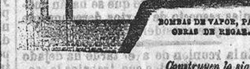
Construyen lo siguiente.

Máquinas de Vapor, para arar y cultivar. Máquinas de Vapor, portátiles y locomobiles. Bombas de Vapor, para obras de regar. Máquinas de Vapor estacionarias horizontales. Trilladoras de Vapor con aparatos (de patente) para despedazar y machacar la paja.