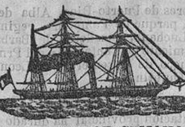
LINEA REGULAR SEMANAL. VAPORES-CORREOS INGLESSES...