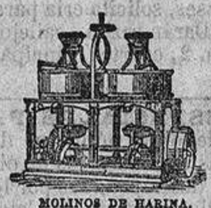
MOLINOS DE HARINA.