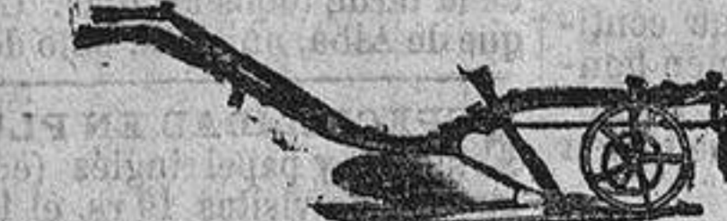
ARADOS PARA CABALLOS, DOS MULAS ó BUEYES.