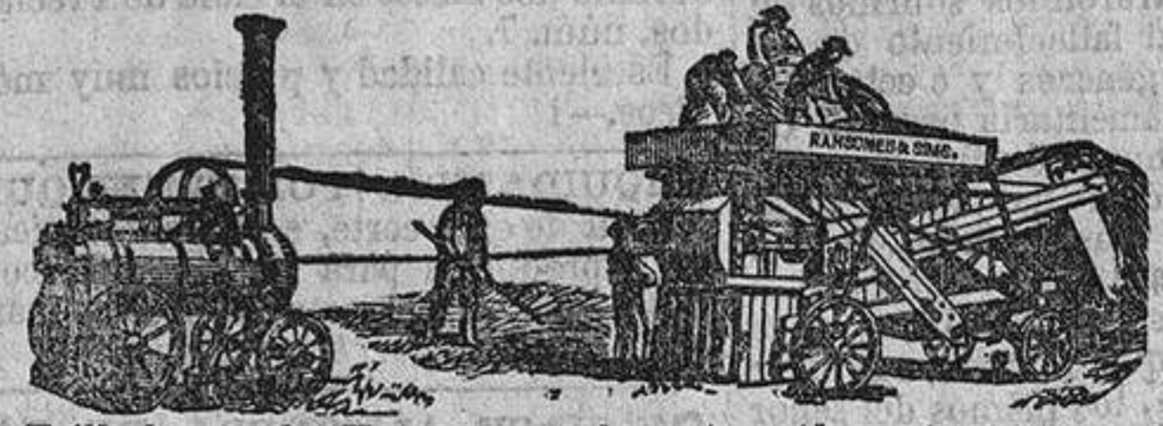
Trilladoras de Vapor, con Aparatos (de patente) para despedazar y machacar la paja.

ORWELL WORKS, IPSWICH, INGLATERRA; 9, GRACECHURCH STREET, LONDRES.