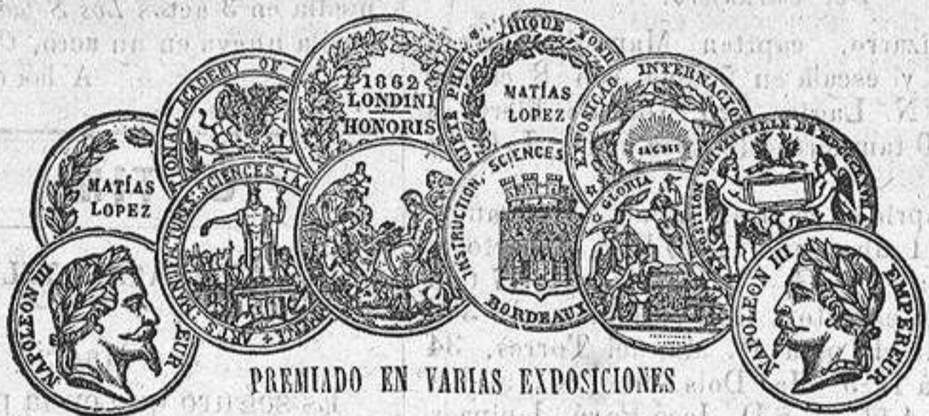
PREMIADO EN VARIAS EXPOSICIONES

Los remedios se venden en cajas y botes, por todos los principales boticarios del mundo entero, y por su propietario, el PROFESOR HOLLOWAY, en su establecimiento central, 533, Oxford Street: (antes 244, Stran.) Londres.