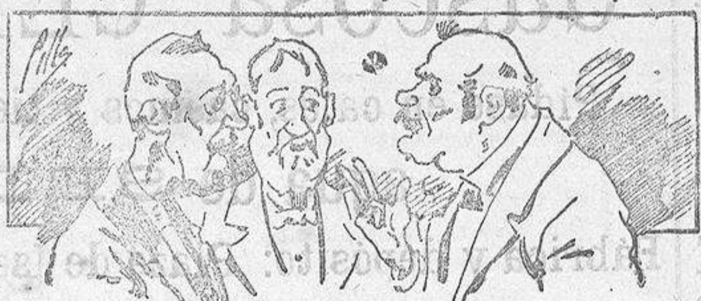
Abominan á nuestros libros..... pero los compran.

Todas las personas de gusto, curiosas é ilustradas deben pedir al Director de LA AVISPA, apartado núm. 8, MADRID, un ejemplar que se remite gratis y franqueado. Esta Revista Enciclopédica Popular publica recreaciones científicas, recetas de cocina, repostería, confitería, vinos, licores, pinturas, barnices, betunes y fórmulas para toda clase de industria, y cuantas noticias y conocimientos puedan ser beneficiosos. Cuenta además con buenos grabados, parte literaria excelente; da regalos mensuales á sus lectores con la Lotería Nacional y participaciones en la misma, á cuyo efecto compra todos los sorteos, y en una de las Administraciones más afortunadas por la suerte, billetes enteros. La suscripción y los números que se nos pidan se sirven gratuitamente á correo vuelto y franqueados, con sólo indicar el nombre y dirección del que lo desea en sobre dirigido al Sr. Administrador de