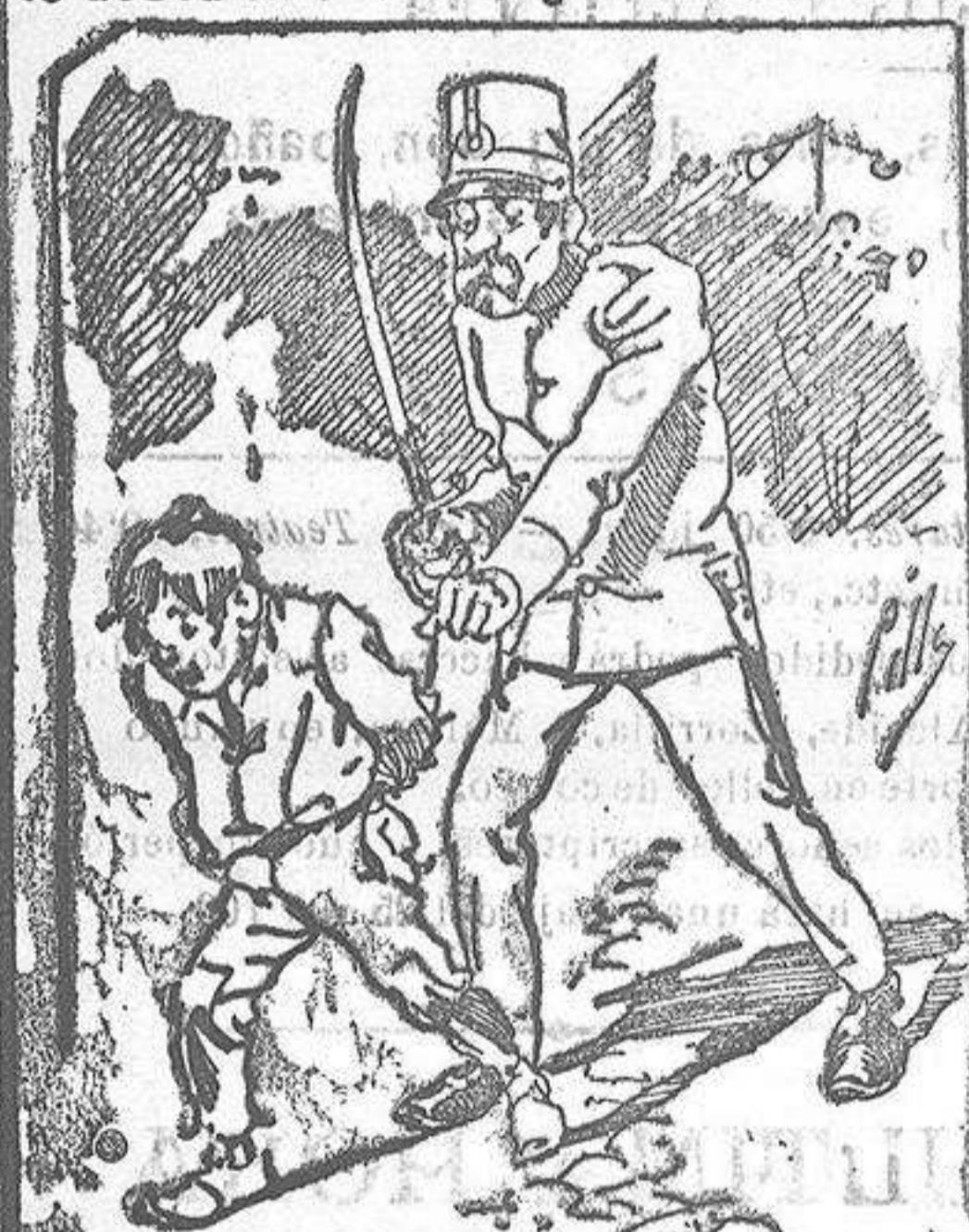
Entregamos de la policía á nuestros vendedores cuando el número pica....

Abominan á nuestros libros..... pero los compran. Lo desea en sobre dirigido al Sr. Administrador de