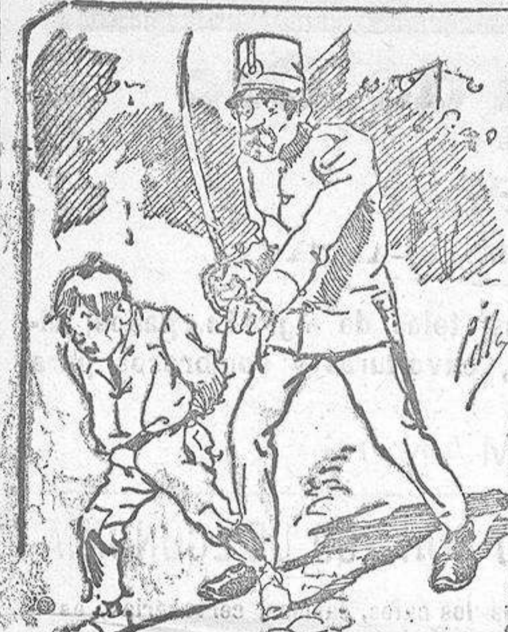
Atentamientos de la policía á nuestros vendedores cuando el número pica....

Si se desea recibir bajo sobre por su INDOLE ESPECIAL, debe remitirse al Administrador un sello de 15 céntimos para su franqueo como carta. También puede pedirse LA AVISPA y el CATÁLOGO RESERVADO en casa de nuestros corresponsales autorizados, si no se quiere escribir á la Administración.