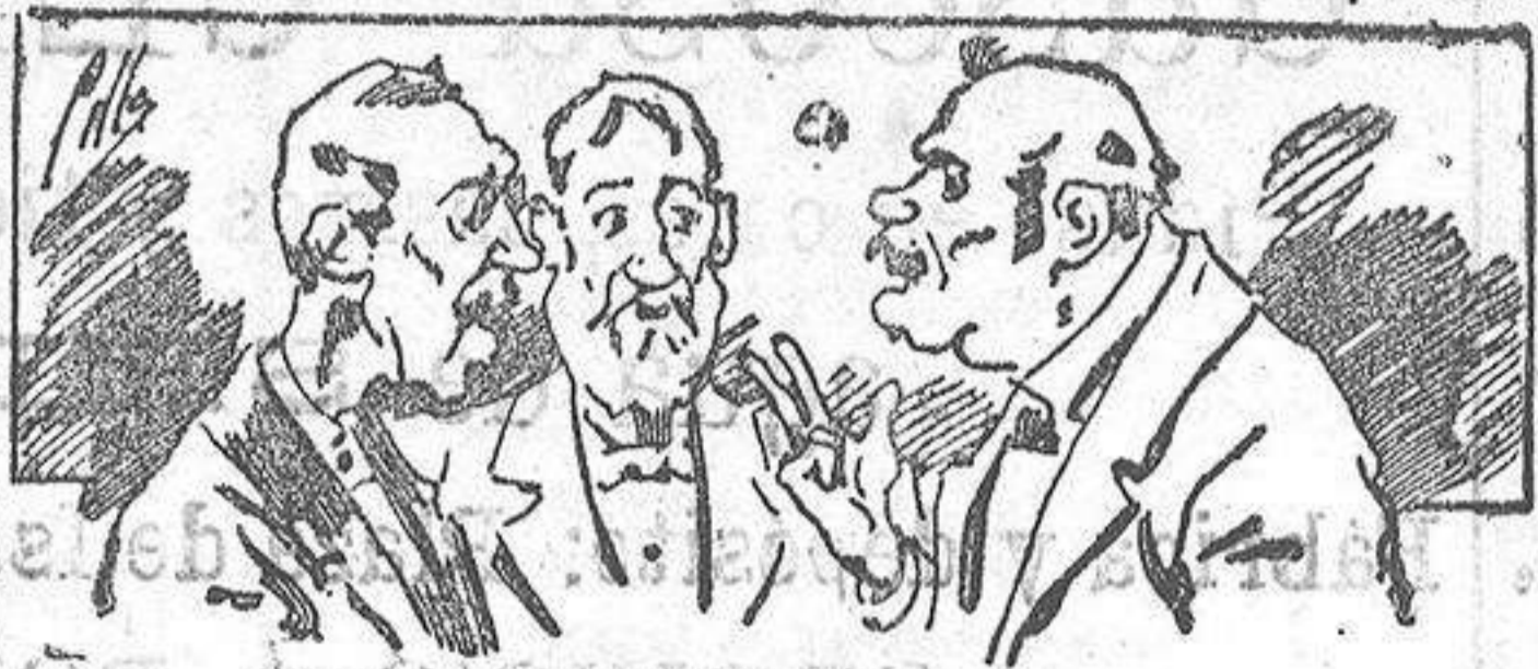
Aborinan á nuestros libros... pero los compran.