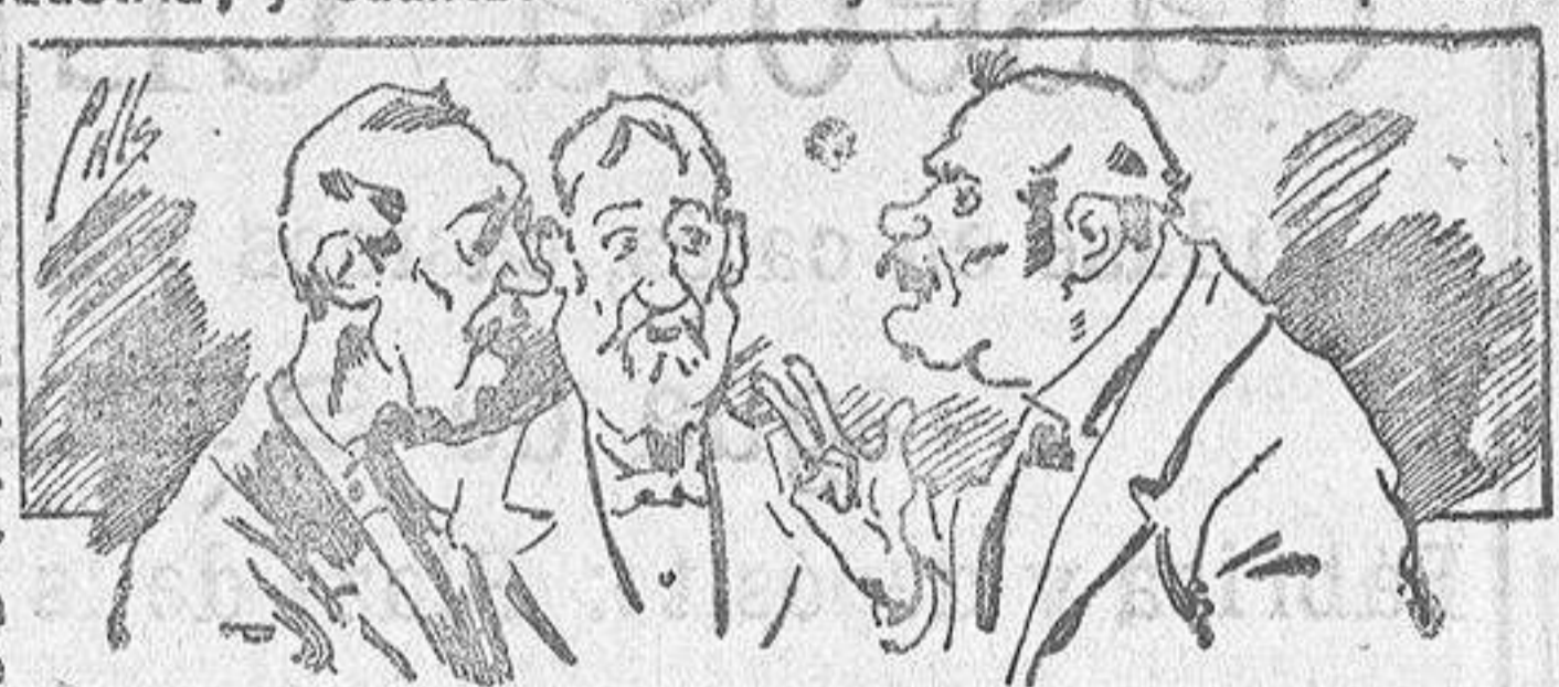
Abominan á nuestros libros....., pero los compran.

Todas las personas de gusto, curiosas é ilustradas deben pedir al Director de LA AVISPA, apartado núm. 8, MADRID, un ejemplar que se remite gratis y franqueado. Esta Revista Enciclopédica Popular publica recreaciones científicas, recetas de cocina, repostería, confitería, vinos, licores, pinturas, barnices, betunes y fórmulas para toda clase de industria, y cuantas noticias y conocimientos puedan ser beneficiosos. Cuenta además con buenos grabados, parte literaria excelente; da regalos mensuales á sus lectores con la Lotería Nacional y participaciones en la misma, á cuyo efecto compra todos los sorteos, y en una de las Administraciones más afortunadas por la suerte, billetes enteros. La suscripción y los números que se nos pidan se sirven gratuitamente á correo vuelto y franqueados, con sólo indicar el nombre y dirección del que lo desea en sobre dirigido al Sr. Administrador de