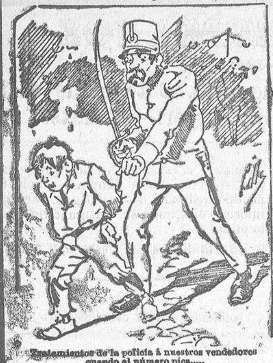
Castigamiento de la policía á nuestros vendedores cuando el número pica....

También puede pedirse LA AVISPA y el CATALOGO RESERVADO en casa de nuestros corresponsales autorizados, si no se quiere escribir á la Administración.