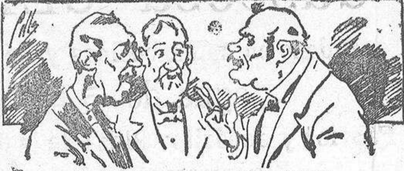
Abominan á nuestros libros..... pero los compran.

ser beneficiosos. Cuenta además con buenos grabados, parte literaria excelente; da regalos mensuales á sus lectores con la Lotería Nacional y participaciones en la misma, á cuyo efecto compra todos los sorteos, y en una de las Administraciones más afortunadas por la suerte, billetes enteros. La suscripción y los números que se nos pidan se sirven gratuitamente á correo vuelto y franqueados, con sólo indicar el nombre y dirección del que lo desea en sobre dirigido al Sr. Administrador de