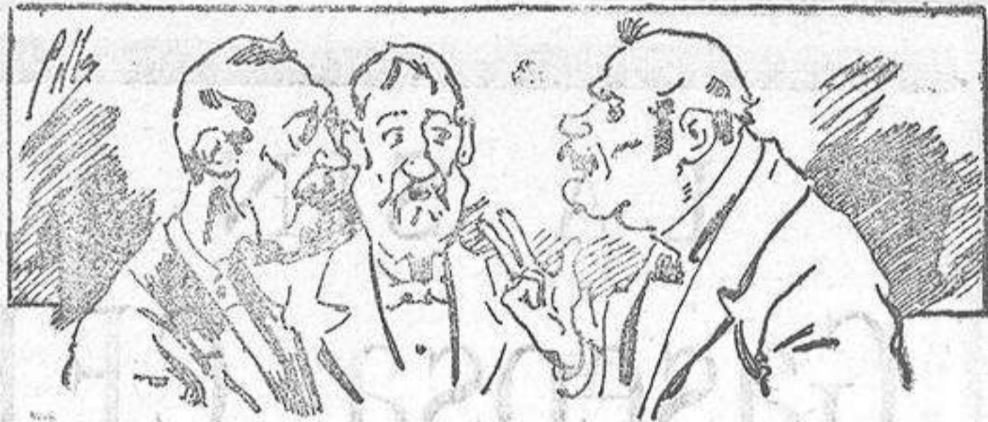
Abominan á nuestros libros....., pero los compran.

fórmulas para toda clase de industria, y cuantas noticias y conocimientos puedan ser beneficiosos. Cuenta además con buenos grabados, parte literaria excelente; da regalos mensuales á sus lectores con la Lotería Nacional y participaciones en la misma, á cuyo efecto compra todos los sorteos, y en una de las Administraciones más afortunadas por la suerte, billetes enteros. La suscripción y los números que se nos pidan se sirven gratuitamente á correo vuelto y franqueados, con sólo indicar el nombre y dirección del que lo desea en sobre dirigido al Sr. Administrador de