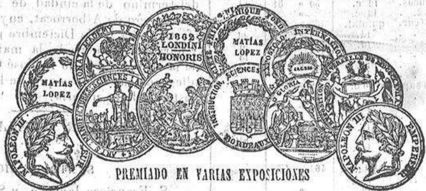
PREMIADO EN VARIAS EXPOSICIONES

Saldrá de Palma para Alicante con escala en Ibiza, todos los domingos á las 8 de la mañana, y de Alicante para Palma, haciendo escala en Ibiza, todos los martes á las 4 de la tarde. Además de la correspondencia publica admite carga y pasajeros. — Lo despecha, sus consignatarios los Sres. A. Campos y Hermanos.