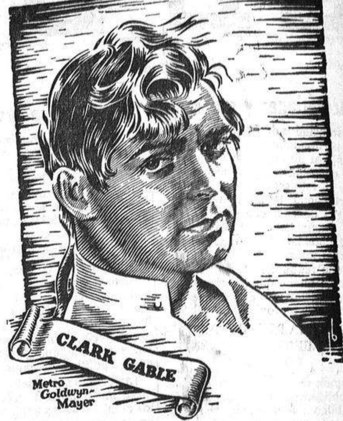
Clark Gable, joven galán que en su película «Rebelión a bordo» constituye un éxito formidable y pronto la veremos en un elegante cine de esta capital.

Tortilla sabrosa.—Picar hierbas finas, un puñado de acederas y una cebolla. Cascar los huevos sazónarlos, añadirles el picadillo y batirlos. Calentar aceite en la sartén y hacer la tortilla como de costumbre.