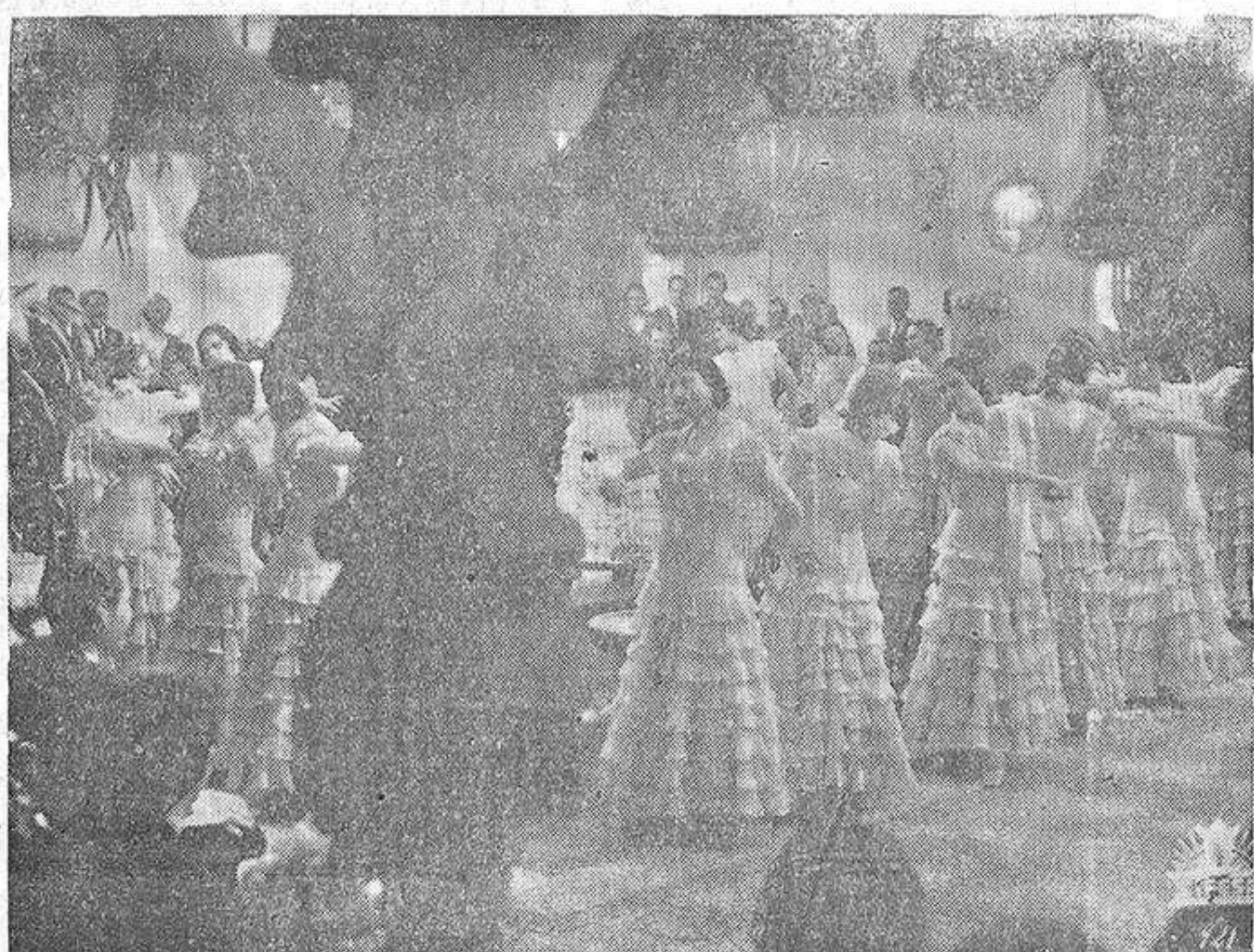
Un magnífico fotograma de la super-producción «Morena Clara» llevada a la pantalla sonora por Florian Rey y protagonizada por la simpatísimisima artista Imperio Argentina

Fabrica y talleres: Avenida de Salamanca, del 13 al 19 Exposición y oficinas: Bailén 20 tel. 2243 ALICANTE