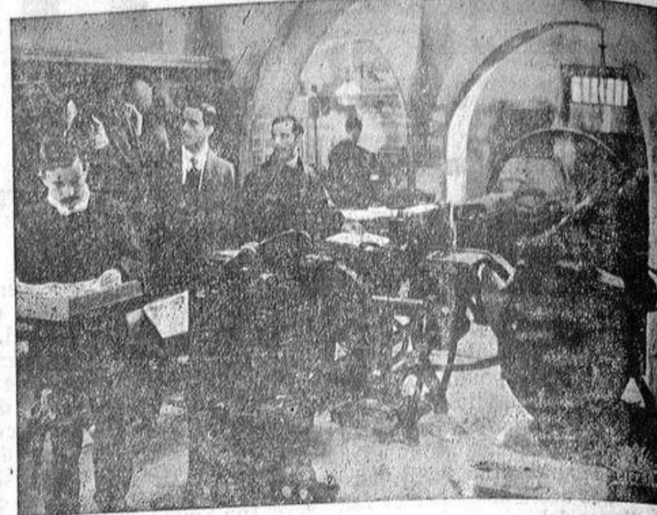
Una escena de «Julían» el cajista en la magnífica película de Cifesa «La Verbena de la Paloma»

por el célebre tenor Nino Martini, y Vicente Escudero. Noticario Fox (semanal estreno.)