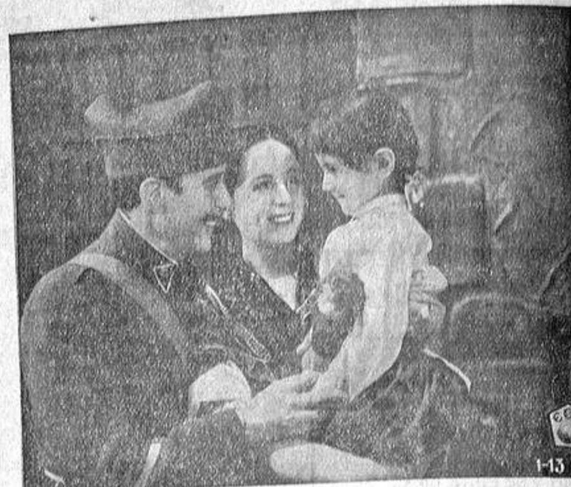
Una escena de la película española «El 113» (El soldado de San Marcial) que protagoniza Ernesto Vilches y presenta Cifesa.