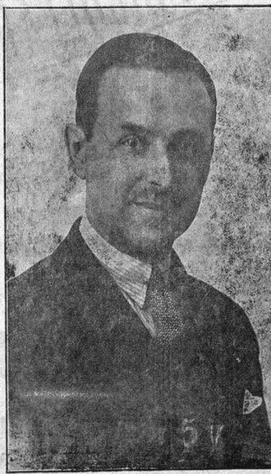
EL BARÓN DE GARCER, DIPUTADO TRADICIONALISTA POR VALENCIA, AUTOR DE LA PROPOSICIÓN DE LEY DEFENDIENDO A LOS PERJUDICADOS POR LAS EXPROPIACIONES EN LA PLAYA DE SAN JUAN

La vida en el teatro PRINCIPAL Ya quedan pocos días para que podamos admirar el sublime arte de la estrella española «La Argentina», que con sus conciertos de danzas canciones y romances populares se presentará el próximo domingo tarde y noche en el Teatro Principal, interpretando un programa selectísimo en el que figuran al lado de las mejores obras de Falla, Albeniz y Gimenez, poema del maximo valor y romances de la belleza admirable del de los peregrinos de Garcia Lorea. «La Argentina» actuará un solo día, y para estas funciones se suceden sin interrupción las demandas de localidades a villo el público de aplaudir nuevamente a la sublime artista.