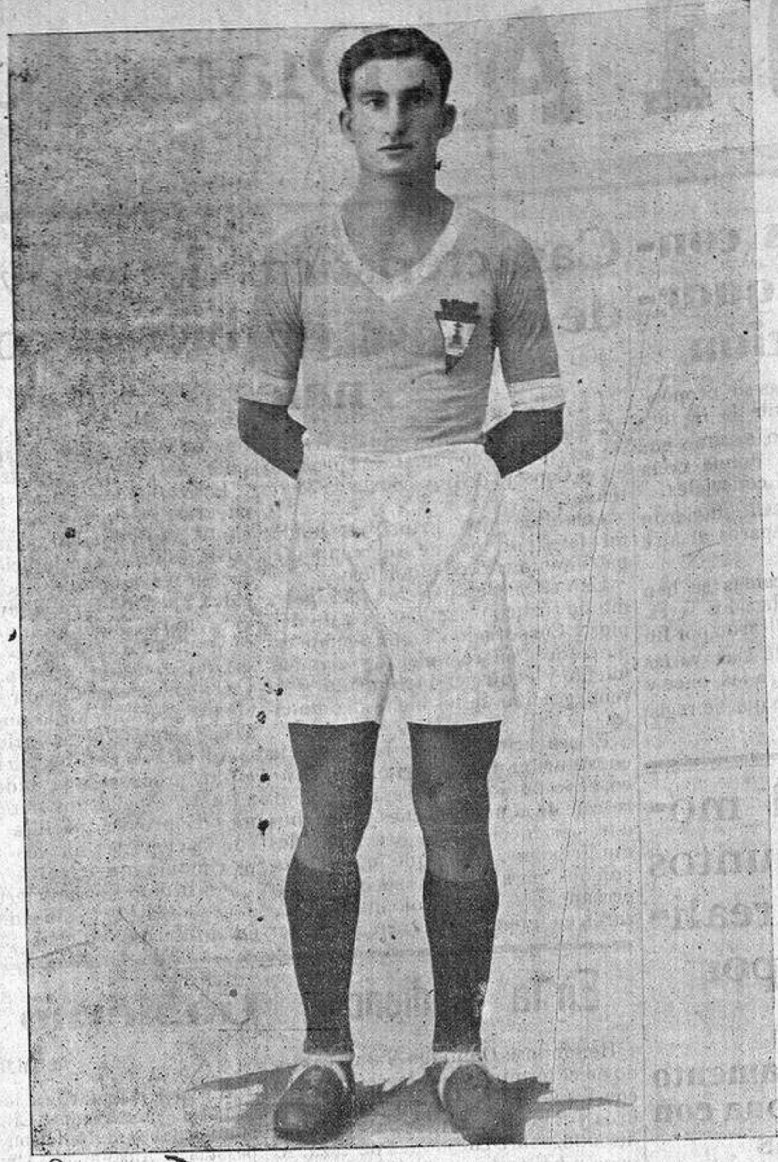
Nieto el ex-alicantinista, que en la actualidad se encuentra bajo las órdenes de Mr. Pentland

Clases de matemáticas (ARITMÉTICA, ALGEBRA, GEOMETRIA, TRIGONOMETRIA, FISICA ETC.) PRECIOS CONVENCIONALES