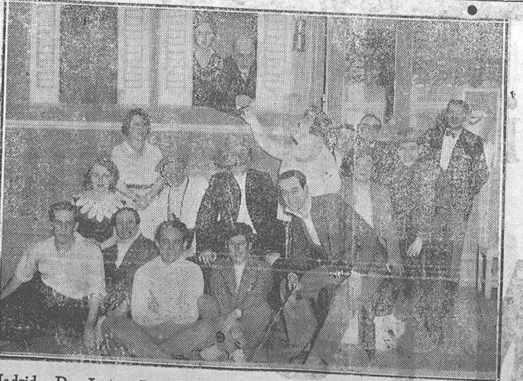
Madrid.—Don Jacinto Benavente con los distinguidos artistas que tomaron parte en la función homenaje a dicho ilustre escritor, celebrado anoche en el teatro Alcazar.