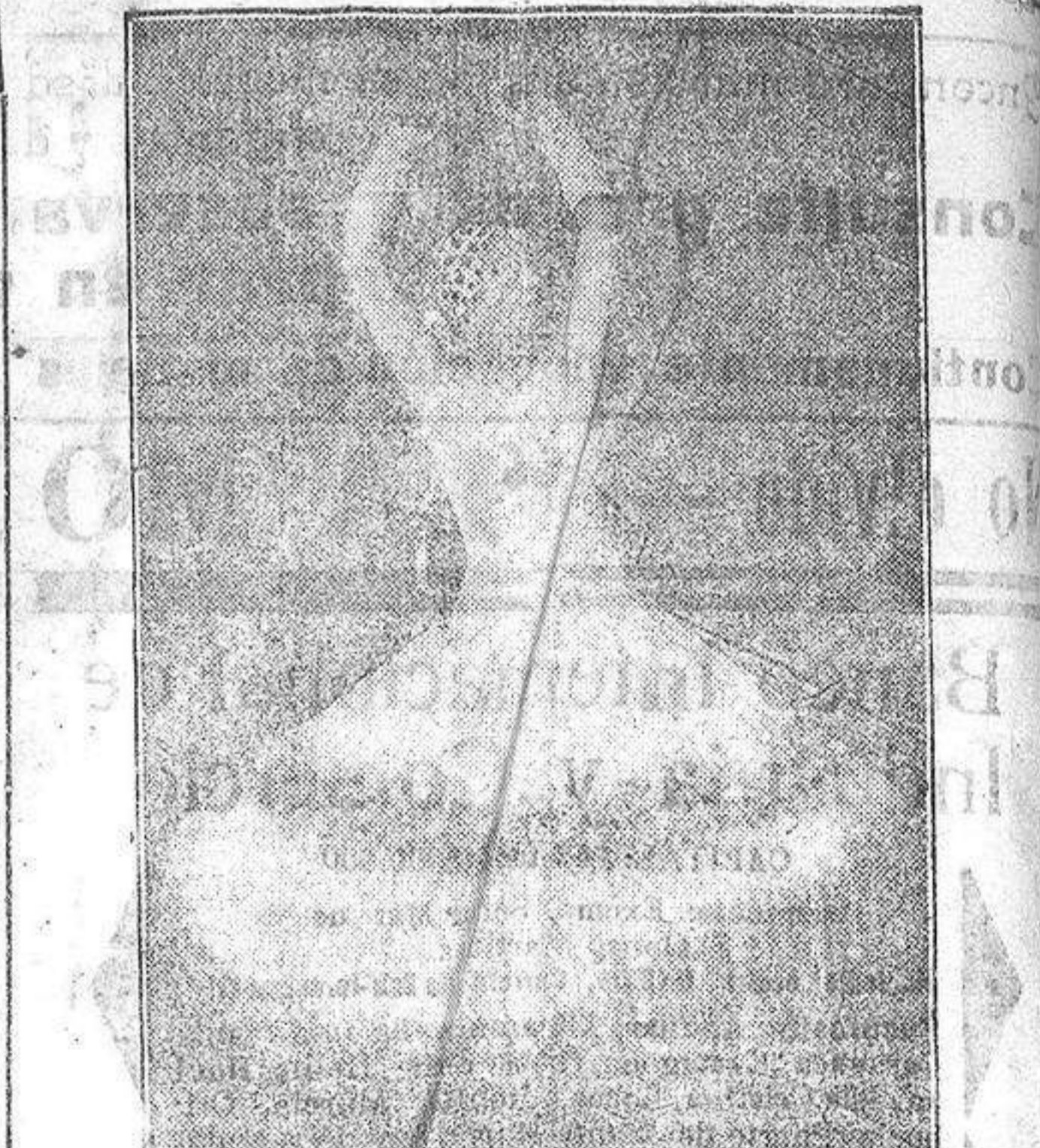
La gentil bailarina Goyesca, que debutó anoche en el Monumental

Para mañana jueves, tres secciones; a las cuatro en punto, a las seis y media y gran gala a las diez en punto Gran éxito Solar de la calle de las Navas, núm. 57.