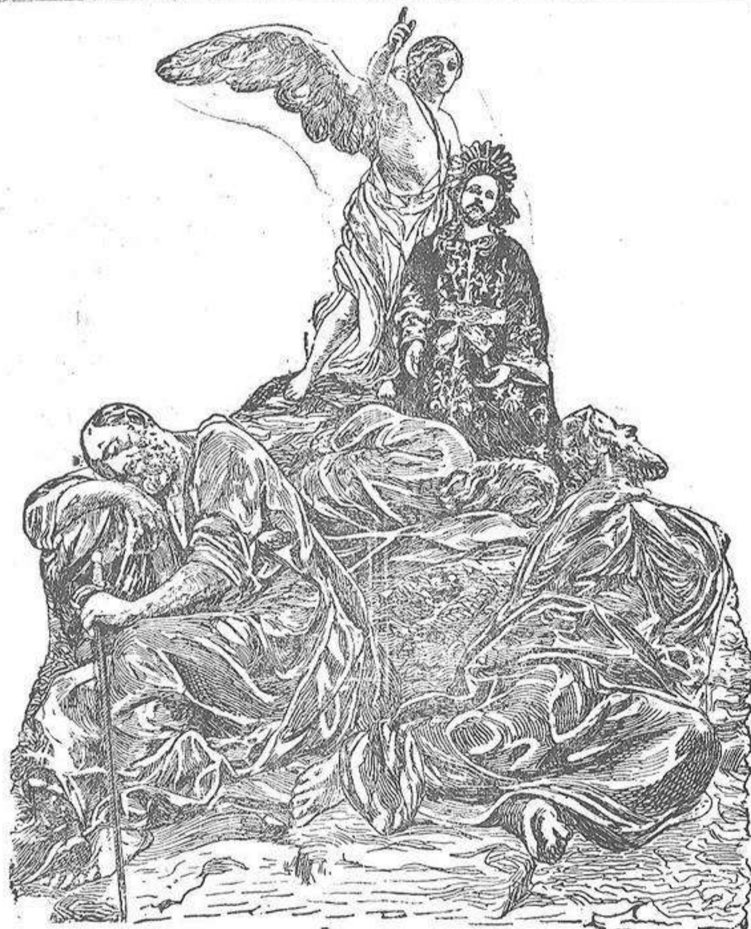
Escenas de la Pasión: la oración del Huerto.

Práctico aparato «Graphos» 48 telas para dominar la mecanografía en tres meses patente de invención 61.368. De texto en Escuelas de Comercio, Academias etc. última palabra de la pedagogía moderna. Especial para oposiciones. Como propaganda sólo 14 pesetas contra reembolso talón f. c. Pídalo a «Graphos». Raimundo Fernández, 10.—MADRID.