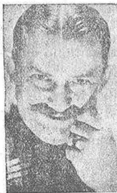
JEAN HERSHOLT Y LYONEL BARRYMORE

Victor Schertzinger ha comenzado a rodar la película «Solamente para caballeros», que interpretan Lillian Harvey y Tulio Carminati.