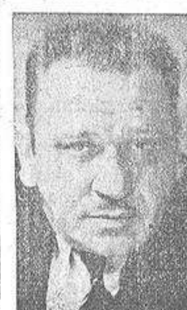
VALLACE BEERY Y LEVI STONE