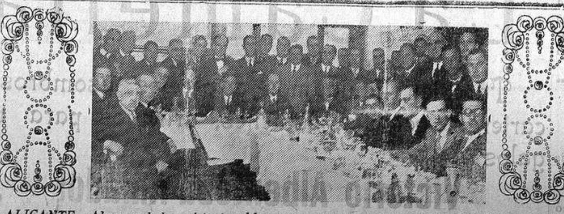
ALICANTE.—Algunos de los asistentes al banquete en honor de los señores Gil Robles y Lucía.