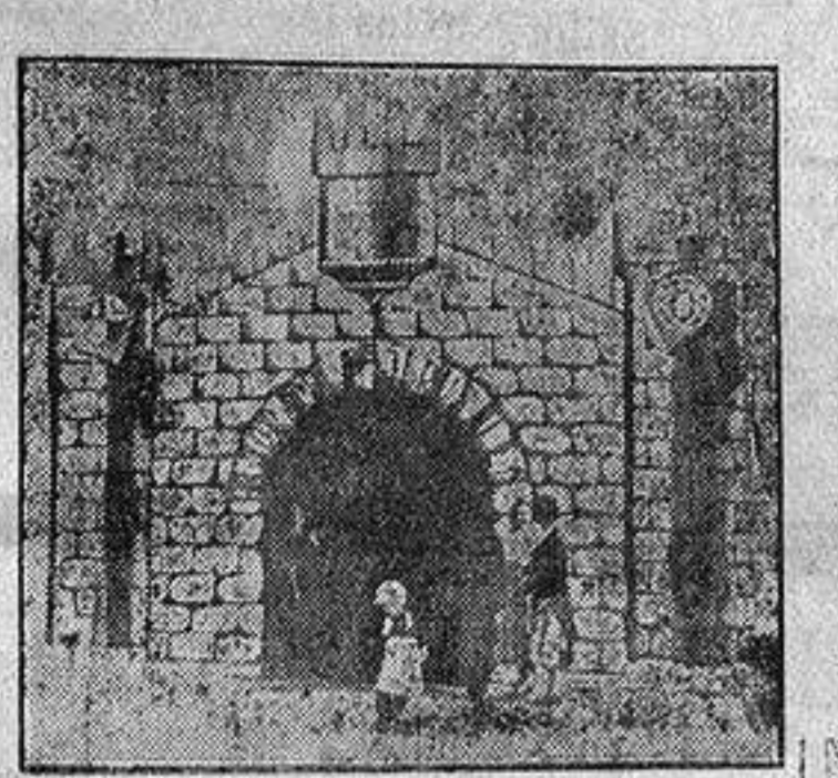
CASETA DEL PANORAMA DE JERUSALEN

MARAVILLA DE MECANICA Y ARTE. SEISCIENTAS FIGURAS MOVIENDOSE, PARECIENDO SEREB VIVOS, TAL ES LA PERFECCION, REPRESENTANDO LA VIDA DE CRISTO. UNA NOVEDAD EN TODO EL MUNDO Y LA ADMIRACION DE TODAS LAS PERSONAS. ABRE TODOS LOS DIAS EN LA FERIA A LAS ONCE DE LA MAÑANA.