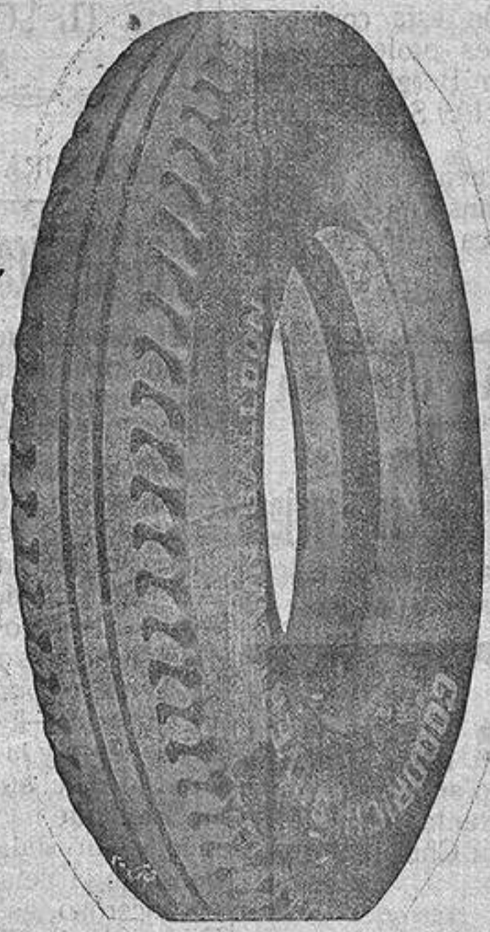
Agente exclusivo para la provincia.