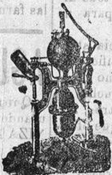
Máquina para hacer gaseosas