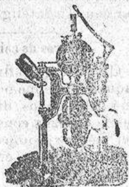
Máquina para hacer gaseosas

Máquinas de vapor, Bombas, Presas, Tubos de todas clases.