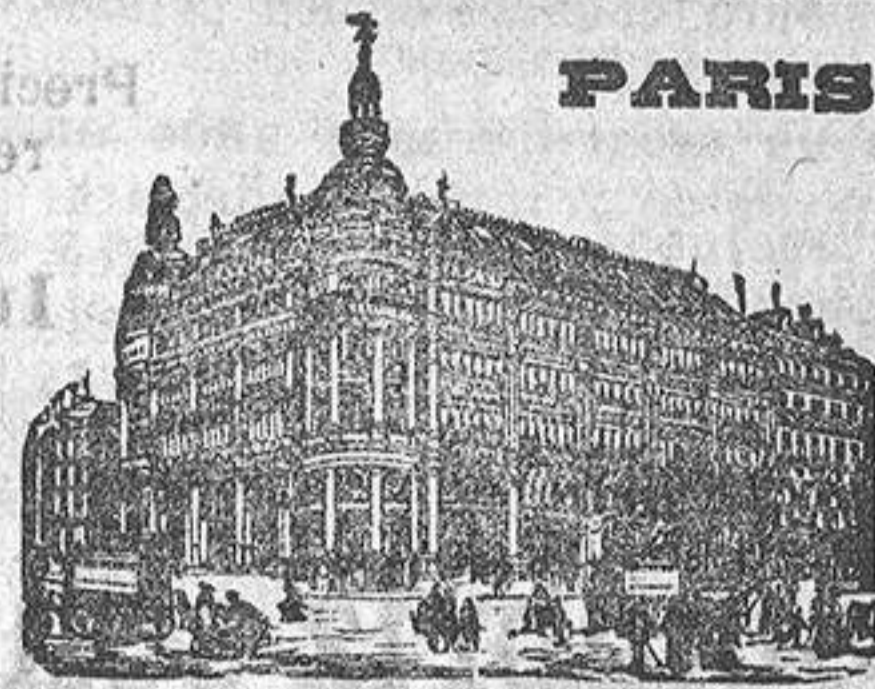
GRANDES ALMACENES DEL