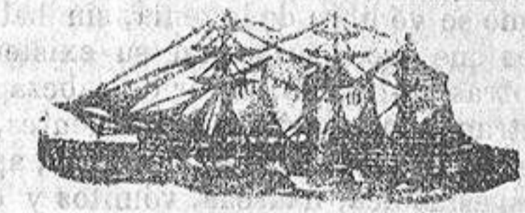
El vapor AGNES

Saldrá de este puerto para el de Rouen el 5 de Mayo; admite carga para dicho punto y Paris-Bercy.