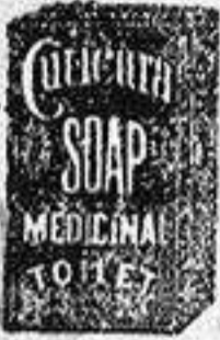
Reducir Copia Exacta.

Y por una sola aplicación de CUTICURA, el gran remedio para la piel y el más puro emoliente, siendo esto el más puro, pronto y económico tratamiento para curar torturas, desfiguraciones, comezones, escamas, crostas y barros de la piel así como los humores del casco con pérdida del cabello. Es recomendado por los mejores médicos y farmacéuticos del mundo.