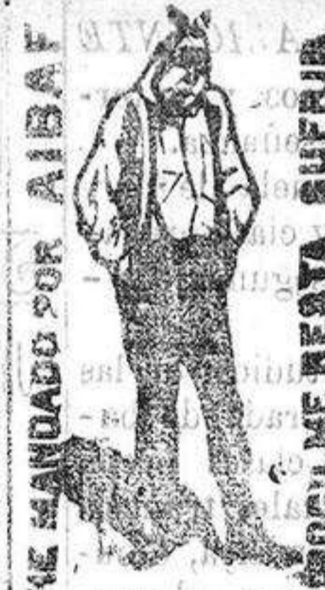
VE MANDADO POR AIBAF