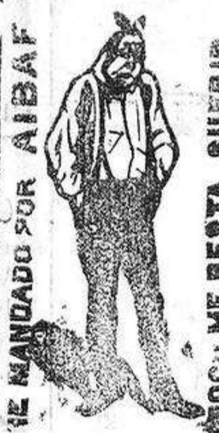
VE MANDADO POR AIBAF