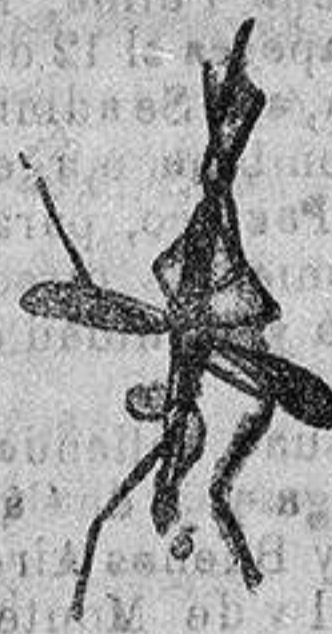
ANOFELLE Mosquito que propaga la fiebre palúdica

Regamos á los señores Doctores, que ensayen en los casos que resultaron incurables con cualquier otro tratamiento, con la seguridad de que después no le abandonarán nunca.