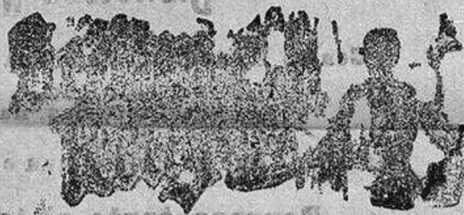
Santo de hoy: San Tomás Santo de mañana: San Juan de Dios

Así mismo en sus conocidos VIERNES Y SABADOS hay una gran sección de saldos, retales y gangas.