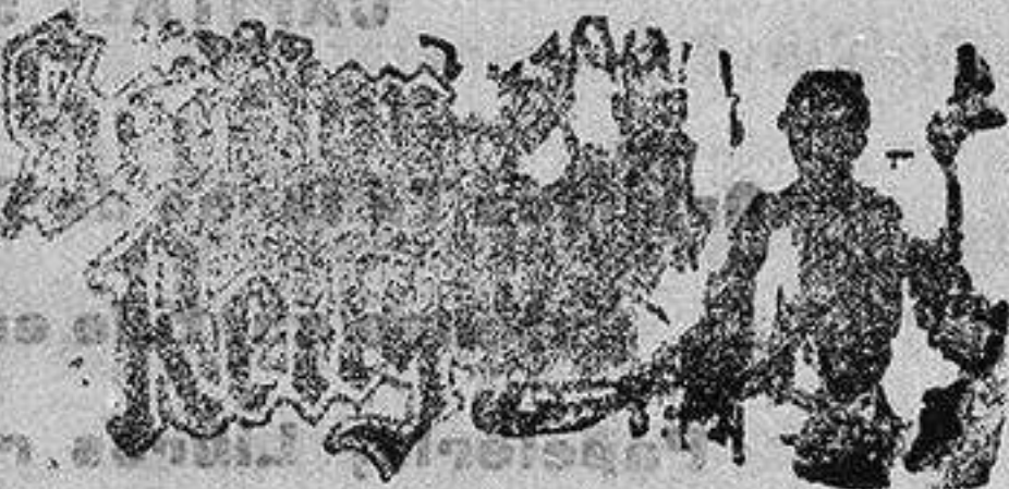
Santo de hoy: San Hemeterio Santo de mañana: San Casimiro

Así mismo en sus conocidos VIERNES Y SABADOS hay una gran sección de saldos, retales y gangas.