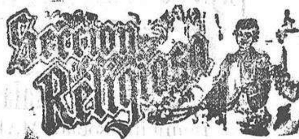
Santo de hoy: La V. del Rosario Santo de mañana: San Sergio

Han dado principio los populares «Viernes» y «Sábado», con saldos, retales y gangas á la cuarta parte de su valor.