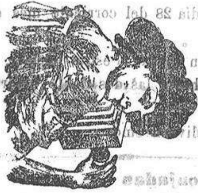
RAMON P. TOMAS