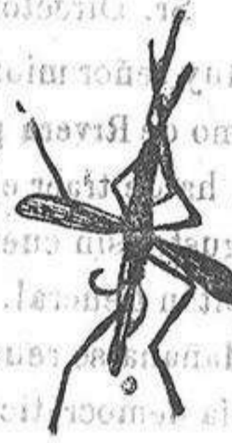
ANOFELE Mosquito que pro- paga la fiebre palúdica

Rogamos á los se- ñores Doctores, que lo ensayen en los ca- sos que resultaron in- curables con cualquier otro tratamiento, con la seguridad de que después no lo aban- donarán nunca.