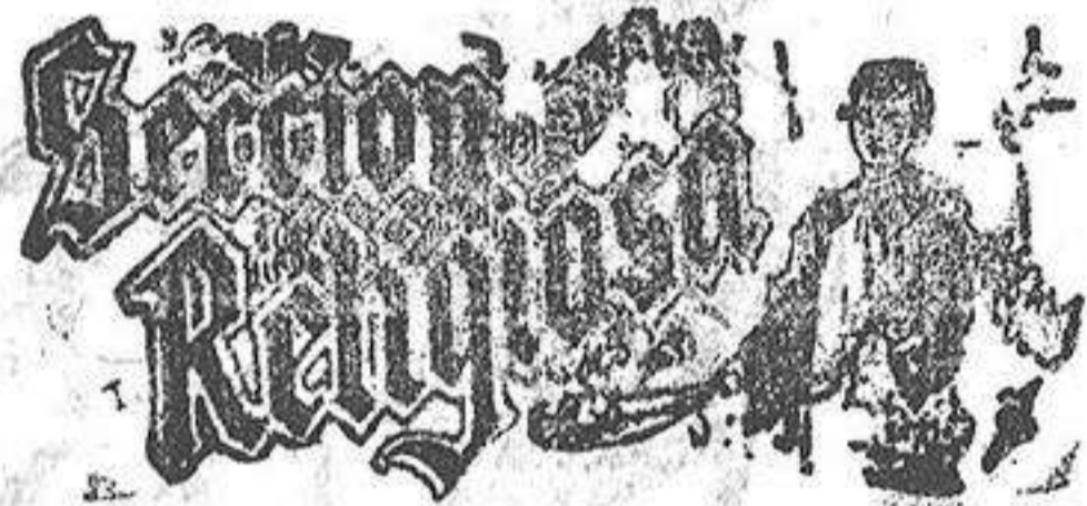
Santo de hoy: San Zoilo Santo de mañana: San León

Se impone el ver el gran surtido que en toda clase de artículos de fantasía, presenta el acreditado establecimiento de tegidos EL SIGLO, predominando entre ellos. económicos y elegantes trajes confeccionados y bordados para señora; ricos etamines calados y bonitas fantasías de seda, así como también se venden muy baratas un millar de sombrillas de todas clases.