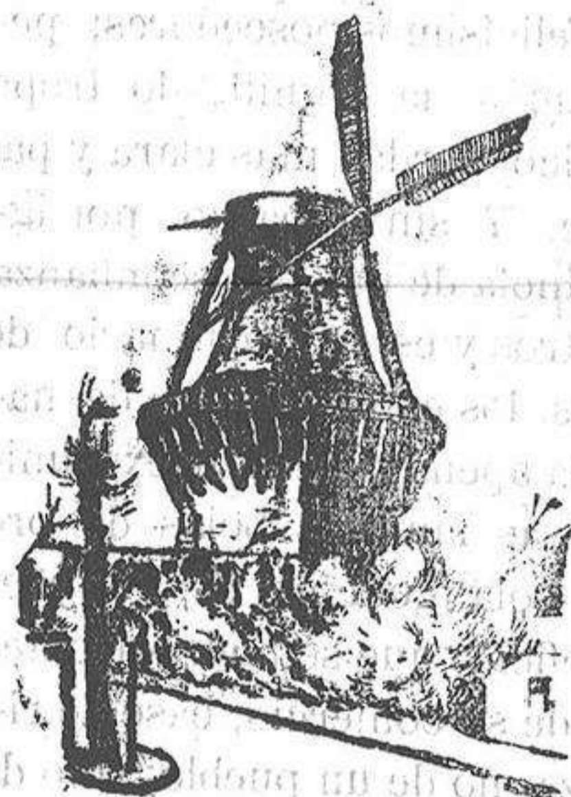
Esta urna, especie de molino de viento,

es la que marcan los Municipios, en cuanto venga la nueva ley electoral.