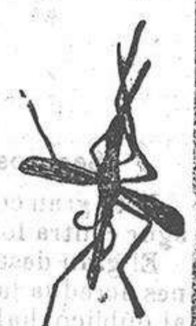
ANOFELE Mosquito que pro-paga la fiebre palúdica

Rogamos á los se-ñores Doctores, que lo ensayen en los ca-sos que resultaron in-curables con cualquier otro tratamiento, con la seguridad de que despues no lo aban-donarán nunca.