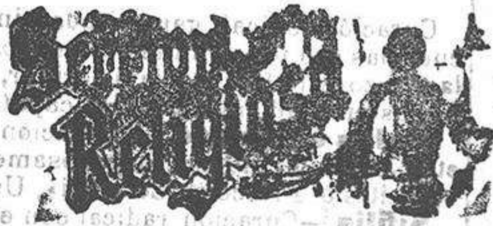
Santo de hoy: San Juan de Dios. Santo de mañana: Santa Francisca

La nueva red adoptada para la pesca de la sardina en la costa de España, y que reproduce nuestro dibujo, es de un hilo plano, formando un cuadro sumamente tupido. A esta red, con ayuda del bote de pesca, se le imprime un movimiento circular y forma una barrera infranqueable en torno del banco de sardina. Por medio de una cuerda colocada debajo del cuadro, la red se transforma en una gran bolsa y los peses no pueden escapar.