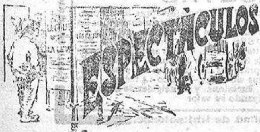
Teatro de Verano.—Funciones por secciones. todas las noches, desde las