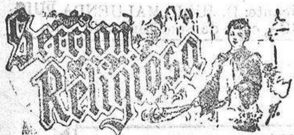
Santo de hoy: S. Bartolomé Santo de mañana S. Luis

Saldos, gangas y retales, casi se tiran en sus VIERNES y SABADOS.