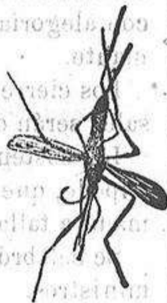
ANOFELE Mosquito que pro-paga la fiebre palúdica.

Rogamos á los se-ñores Doctores, que lo ensayen en los ca-sos que resultaron in-curables con cual-quier otro trata-miento, con la segu-ridad de que después no lo abandonarán nunca.