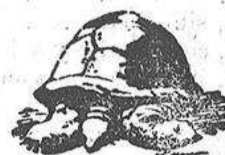
Una tortuga de tres siglos