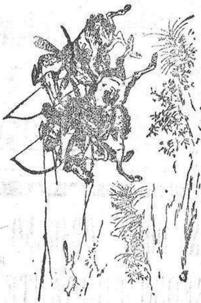
(Facsimile de un dibujo japonés)

La caza de la zorra es también una gran diversión para todas las clases sociales. No se persigue sino á la zorra negra, porque las de otro color son objeto de gran veneración, hasta el punto de vérselas disecadas en algunos templos.